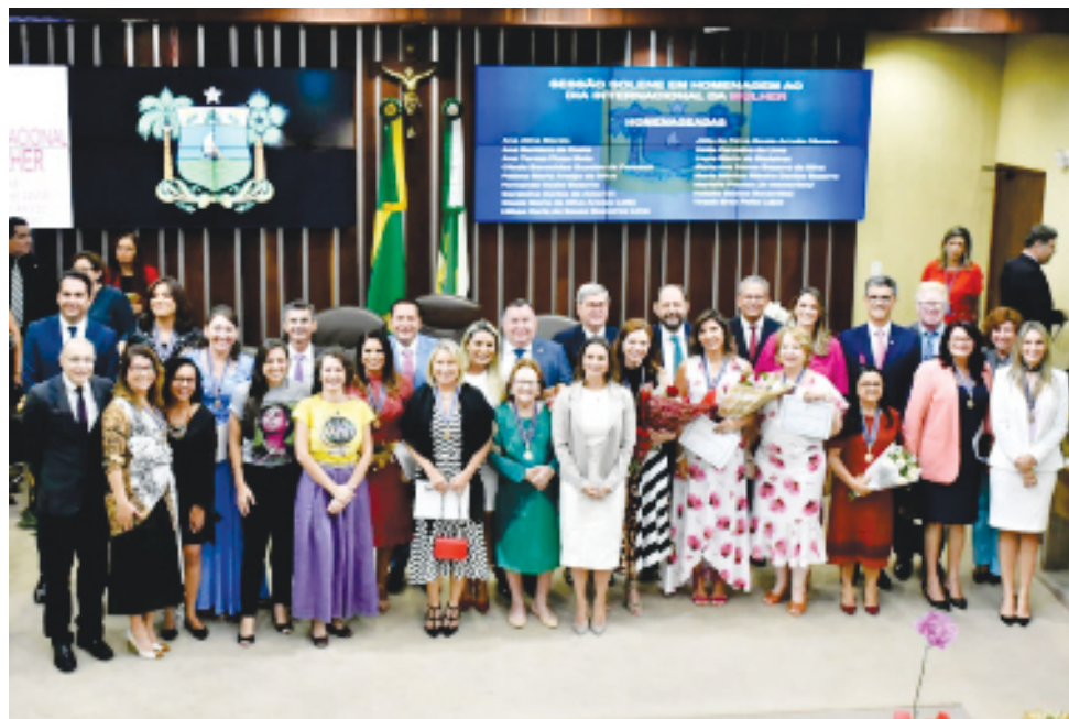
As mulheres orgulhosamente homenageadas