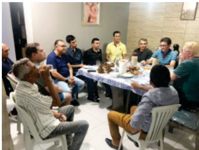
Junto aos amigos de Equador

mas eleições, também em Elói de Souza", disse o deputado.