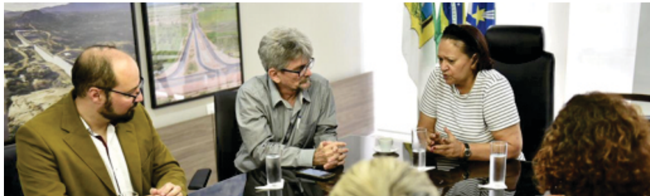
Governadora Fátima Bezerra baixou Decreto de Urgência

- Os passageiros e a tripulação de voos e