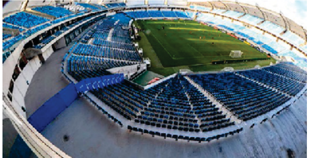
Estádio Arena das Dunas, será um possível hospital de campanha

Entendendo o regime de urgência do pedido da governadora Fátima Bezerra, aprovamos na Assembleia Legislativa à unanimidade o Decreto Governamental Nº 29.534, de 19 de março de 2020, que declara estado de calamidade pública no Rio Grande do Norte, em razão da grave crise de saúde pública decorrente da pandemia COVID-19, o novo coronavírus e suas repercussões nas finanças públicas no RN. O documento aprovado pelos deputados estaduais