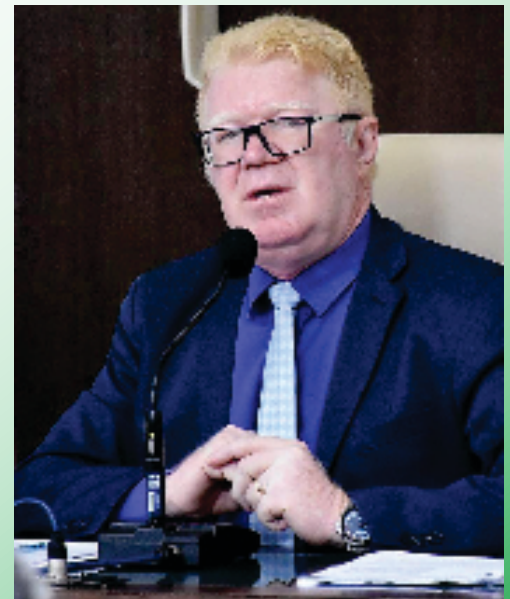
Deputado Ubaldo Fernandes

“Estamos solidários com as ações tomadas pelo Executivo em defesa da saúde da população”