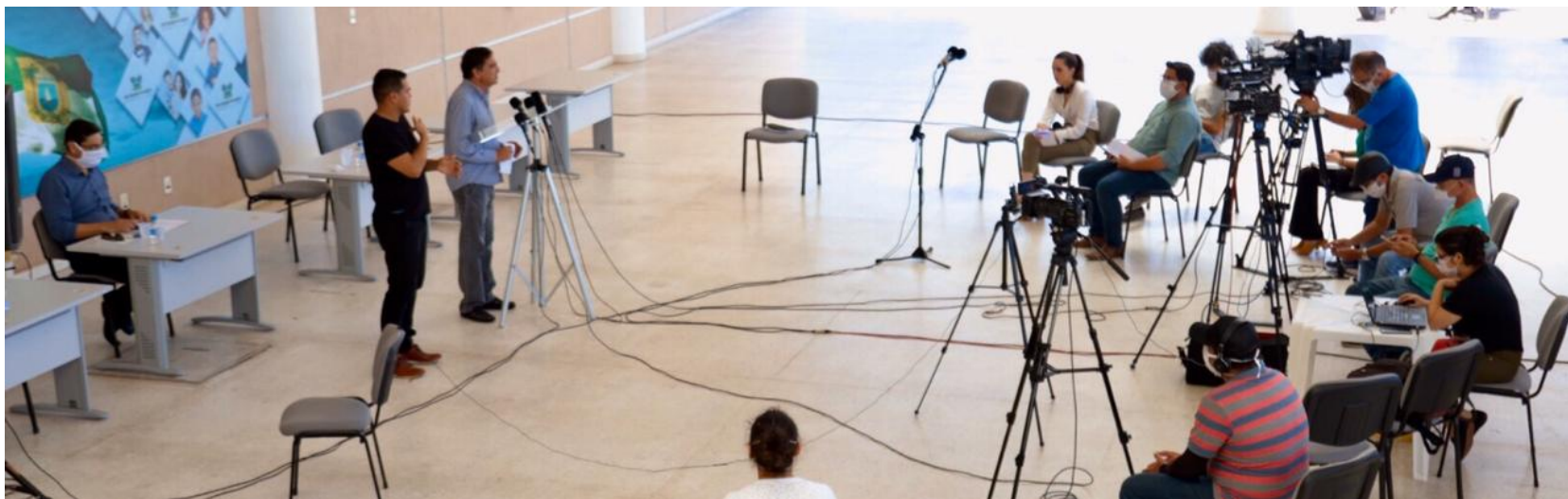
Coletiva com a imprensa com a área do governo

Segundo a SESAP, nos últimos dias o Rio Grande do Norte apresentou 3.086 casos suspeitos, foram descartados 2.682 casos, teve 708 confirmados, foram recuperados 289, e houveram 34 óbitos até quinta-feira (23). Com esses novos dados, o Governo do Estado reeditou novas medidas.