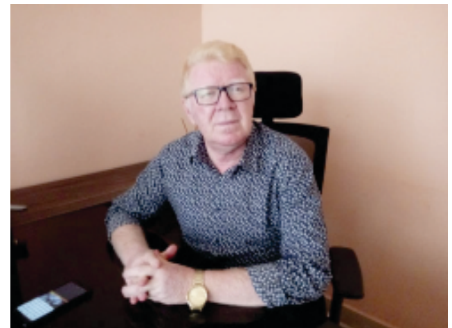
“Confiado em Deus, logo sairemos dessa pandemia”

âmbito econômico o nosso futuro, pois há poucos meses o nosso Estado dava sinais de recuperação, ou seja, começava a colocar a casa em dia, como por exemplo, pagamentos de funcionários e fornecedores em dia, visando até pagamentos há muito questionados. Quis o destino que, sem esperar, convivêssemos com essa pandemia. Então, é notório que não só o nosso Estado e municípios, incluindo o País como um todo, vai se endividar muito mais, e vamos conviver com dois grandes problemas seríssimos, o pós-pandemia, e o financeiro que inclui o social, e a meu ver, levará muito tempo para se restabelecer. Será realmente um grande problema para todos nós enfrentarmos, isso em decorrência da quarentena com fechamentos de indústrias, lojas e departamentos sem produzirem, o que aumentará o desemprego. Então, o amanhã será muito difícil para o restabelecimento da economia do nosso País”.