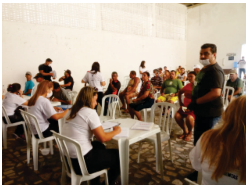
As famílias cadastradas receberam as cestas básicas