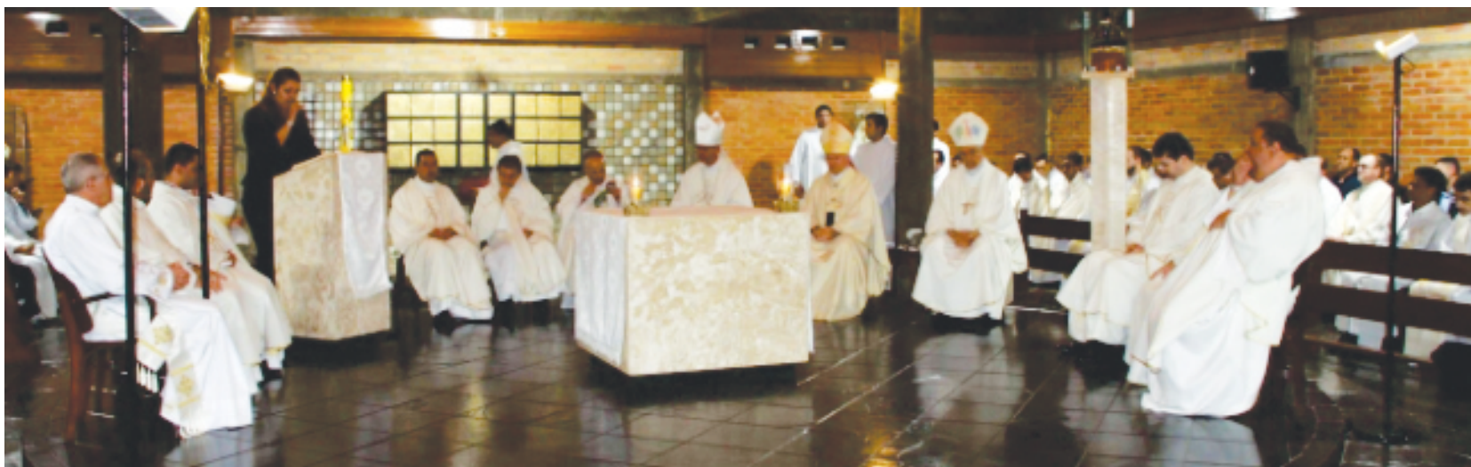
A igreja reza pela paz e a saúde das famílias