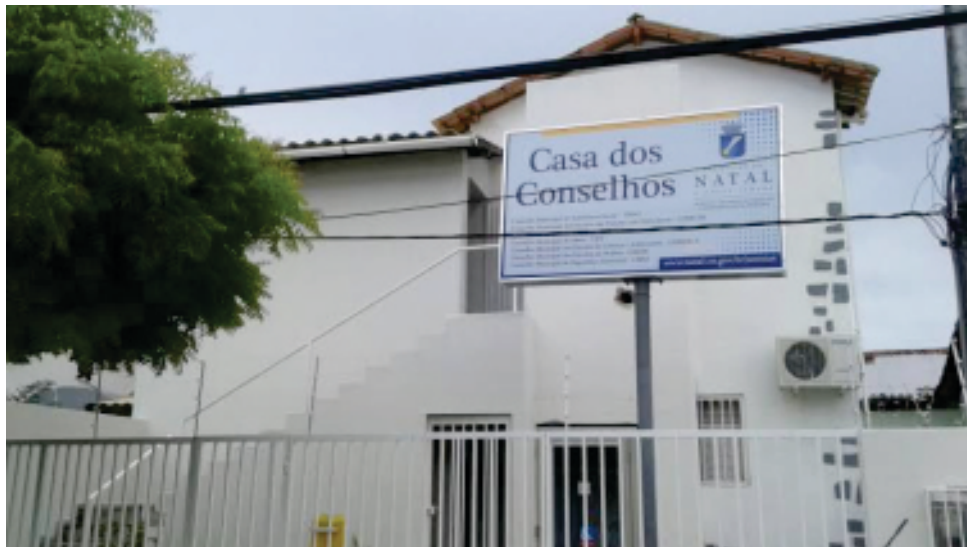
Sede do Conselho, ponto de arrecadação m Natal

Idoso, enquanto órgão do controle social ao qual além de suas atribuições como consultor, fiscalizador e deliberativo, não poderia ficar inerte diante de tantas demandas e ainda tendo a obrigação na defesa dos direitos das pessoas idosas, tem estado muito atento quanto a pandemia, construindo uma comunicação direta entre o Conselho, o Ministério Público, a Vigilância Sanitária, e algumas secretárias do município de Natal, com o intuito de proteger não só as pessoas idosas acolhidas nos abrigos como também os profissionais que cuidam dos idosos. Ainda em março, já prevendo o que iria acontecer, a Vigilância Sanitária com o apoio da Federação das Câmaras de Dirigentes Lojistas do Rio Grande do Norte realizou um treinamento no auditório da CDL Natal para todas as instituições de longa permanência (abrigos) de Natal, onde participaram 21 representantes de abrigos filantrópicos e privados recebendo