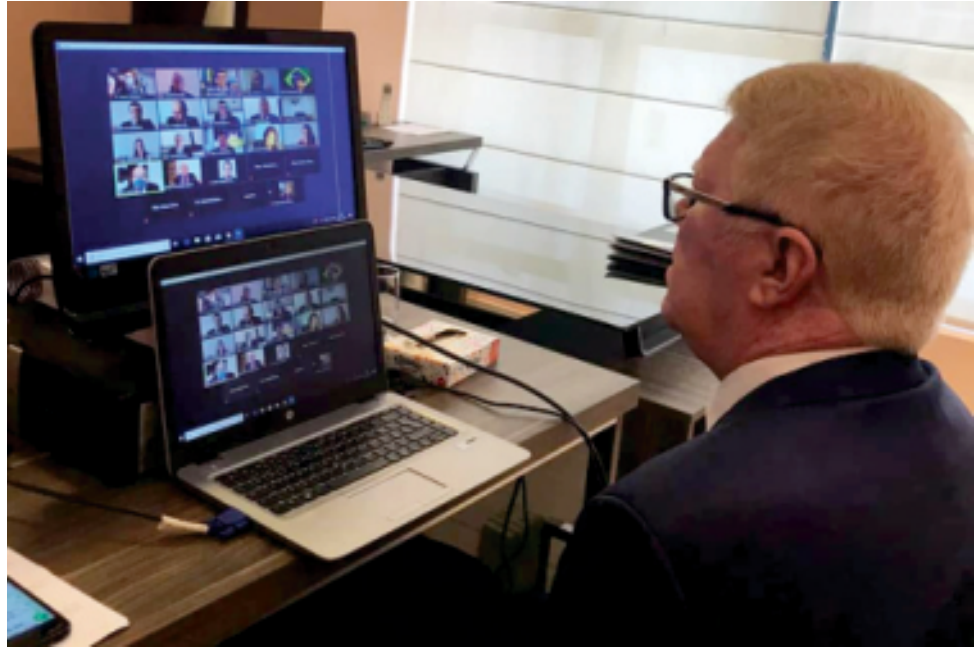
Mesmo à distância, continuam as elaborações de projetos

Os municípios são Apodi, Afonso Bezerra, Angicos, Baía Formosa, Barcelona, Baraúna, Boa Saúde, Campo Redondo, Ceará Mirim, Doutor Severiano, Extremoz, Lagoa de Pedras, Macaíba, Monte Alegre, Monte das Gameleiras, Natal, Pau dos Ferros, Santa Cruz, Santana do Matos, São José do Campestre, São Miguel, São Rafael, Serra Caiada, Serra do Mel, Serrinha, Taipu, Umarizal, Upanema e Vera Cruz.