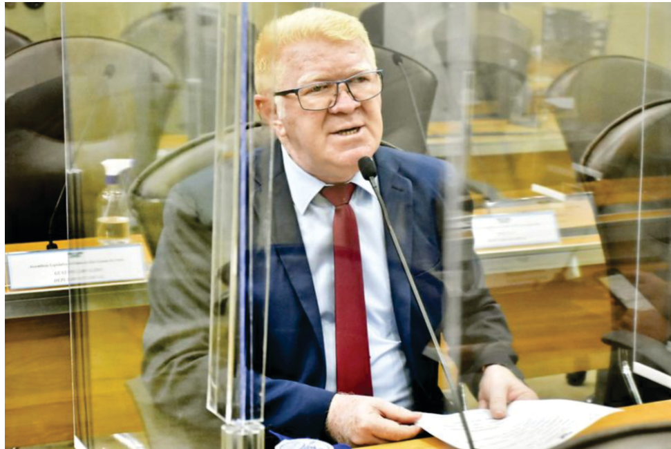
O deputado solicitou maiores cuidados com o idoso

Segundo enfatizou, todos os atores envolvidos na rede protetiva do idoso estão preocupados com a situação atual, diante de novas variantes do vírus, e crescimento assustador de casos que apontam que o Rio Grande do Norte tem registrado, nos últimos dias, um aumento na taxa de ocupação geral de leitos críticos para