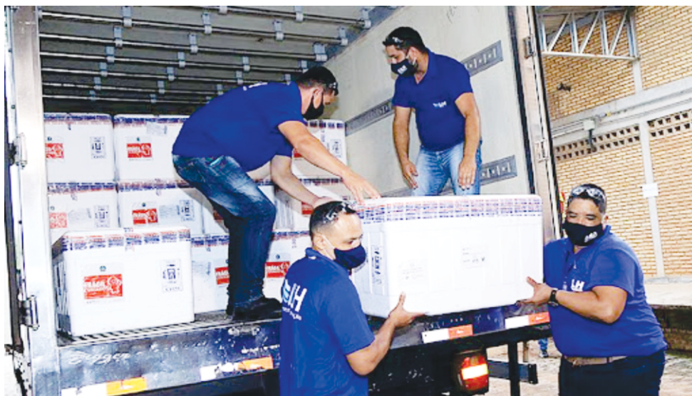
A chegada da Vacina

O caso é grave, mas, infelizmente, a incompreensão de alguns participando de aglomerações durante o período carnavalesco permaneceram, registrando um aumento dos casos por todo o nosso estado, que