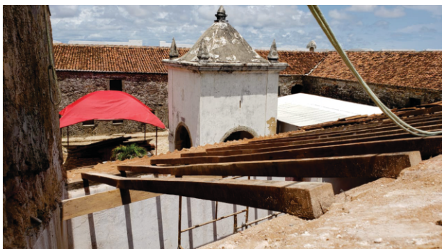
Forte dos Reis Magos continua sendo restaurado

“Vamos acompanhar e cobrar as conclusões das obras que estão em andamento, obras essas importantes e fundamentais pra retomada da nossa principal atividade econômica, visto sua menção ao turismo, equipamentos importantíssimos pra região Leste de Natal e todo o estado, como o Forte dos Reis Magos, o Teatro Alberto Maranhão e a abertura já nesse primeiro semestre de 2021 da Rampa da Ribeira. - Pág. 07