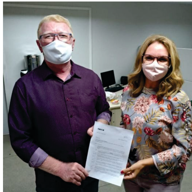
Deputado fez entrega de ofício a secretária