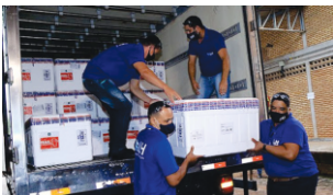
A chegada da Vacina

É o tema abordado pelo nosso Editorial este mês