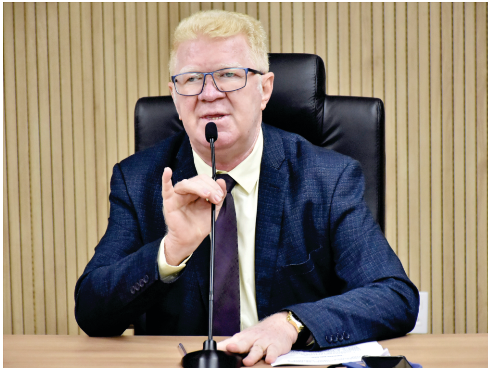
Entre outros assuntos levantados pelo parlamentar, estão o assédio sexual, o transporte coletivo, e a verba destinada para a cidade de Tangará