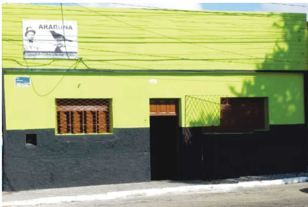
A sede da Associação está sendo zelada