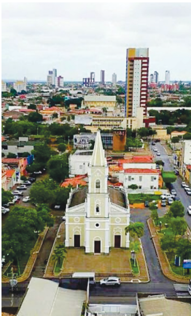
Em primeiro plano, a Igreja de São Vicente