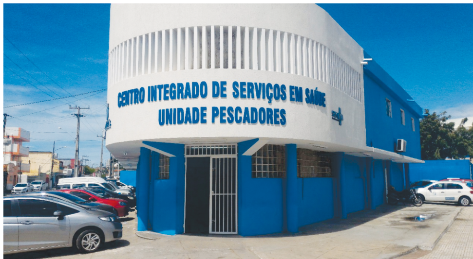
O benefício é para todos

"Abrimos 10 leitos de UTI no Hospital de Campanha, hoje contamos com 30 leitos de UTI na rede municipal, e agora reestruturamos o Hospesc com mais 30 leitos clínicos. Portanto, enquanto a vacinação ainda não está disponível para todos, pedimos para a população fazer a sua parte, evitando aglomerações, usando máscaras e mantendo a higienização das mãos", disse o secretário municipal de Saúde de Natal,