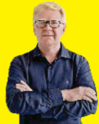
Deputado Ubaldo Fernandes

A Frente Parlamentar em Defesa e Valorização dos Direitos da Pessoa Idosa da Assembleia Legislativa do Rio Grande do Norte, presidida pelo deputado Ubaldo Fernandes (PL), tem encampado ações importantes na defesa dos direitos da pessoa idosa. Desde o ano passado, com o surgimento da pandemia, o trabalho tem se intensificado, com ênfase na atenção aos idosos e às políticas públicas direcionadas a essa população. Na luta para que 100% dos idosos do RN sejam vacinados e estejam imunes ao novo coronavírus, a Frente Parlamentar, em conjunto com outras instituições, lançou a campanha "Vacina é Vida". "As adesões que estamos recebendo nos garantem que estamos no caminho certo. Com o apoio de diversos segmentos, a campanha seguirá por todo o Estado, porque vacina é vida e esperança", garante Ubaldo Fernandes.