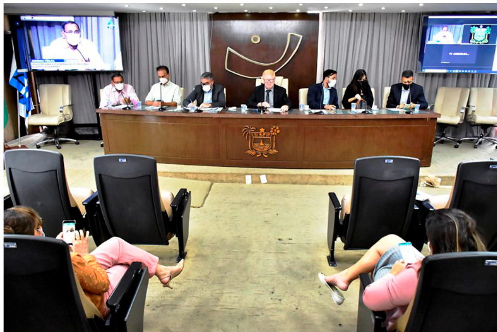
Na Audiência compareceram vários representantes dos órgãos envolvidos

Ele também tratou da questão do Largo da Rua Chile, reiterando que, de acordo com os produtores culturais, a Codern cobrava uma taxa de R$10 mil para utilização do espaço. “Não sei se isso procede, mas a Codern pode se pronunciar sobre isso. Acho fundamental também que a Semurb se posicione em relação ao domínio daquela área, porque não foram poucos os produtores culturais se queixaram da inviabilidade da realização de